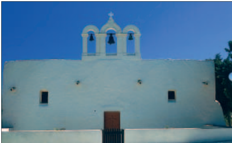
Die Annunciation Church in der Santa Marija Bay

auch als Verbannungsort für Schwerverbrecher. Diese waren dazu verurteilt, Kümme anzubauen, der im maltesischen „Kemmuna“ heißt und von dem die Insel ihren Namen hat. Wegen ständiger Piratenüberfälle baten die Malteser im Jahr 1416 den sizilianischen Vizekönig um den Bau eines Wachturms. Eine Weinsteuer sollte ihn finanzieren, doch das dafür gesparte Geld riss sich König Alonso V. von Spanien unter den Nagel. So machte Comino bis zu Anfang des 17. Jh. lediglich als Seeräubernest hin und wieder von sich reden. Großmeister Aloff Wignacourt ließ schließlich 1618 einen Wachturm errichten und erhob Comino zu seinem privaten Jagdrevier. 1715 ergänzte man den Turm weiter östlich um eine Redoute, eine trapezförmige Befestigungsanlage. Als keine Großmeister mehr jagten und die Zeit des Ordens vorüber war, pachteten Bauern gegen Ende des 18. Jh. das Eiland. Mehr als 200 Personen sollen auf Comino einen Existenzversuch unternommen haben. Wegen mangelnder Erträge verließen die meisten aber schon bald wieder die Insel. Während des 1. Weltkriegs bauten die Briten ein Quarantänehospital darauf. In dieser Zeit soll es auch ein Postamt, einen Lebensmittelladen und ein Café gegeben haben. Nach der Unabhängigkeit Maltsas 1964 kam das erste und bislang einzige Hotel hinzu. Der letzte größere Trubel herrschte im Jahr 2000 auf Comino, als hier Teile des Films Der Graf von Monte Christo gedreht wurden.