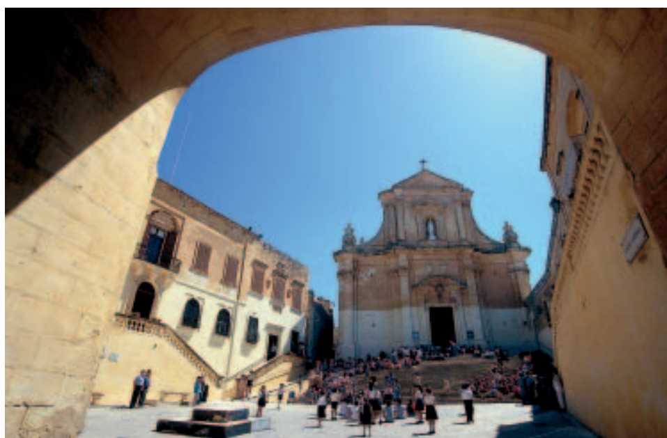
Die Kathedrale in der Zitadelle Victorias