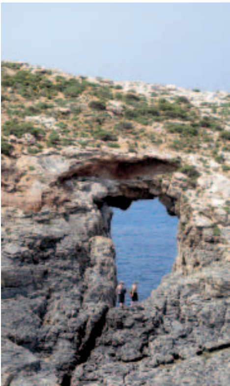
Abenteuer Malta – Wandern auf Comino

Hinter dem kleinen Sandstrand geht es an der Küste entlang weiter, dem Comino Tower entgegen. Mehrere Pfade stehen zur Auswahl; je näher an den Klippen man sich hält, desto imposanter ist der Blick auf das darunter liegende Farbenspiel des Meeres und auf die in den Buchten ankernden Segelyachten.