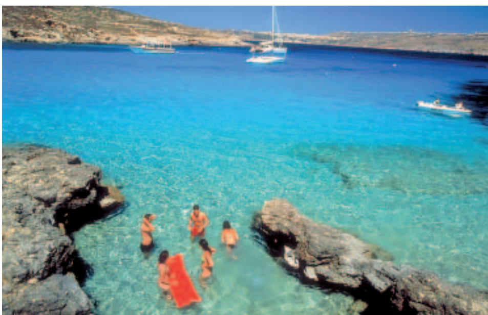
Badefreuden in der Blue Lagoon