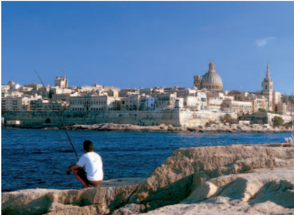
Fischer im Marsamxett Harbour – im Hintergrund Valletta