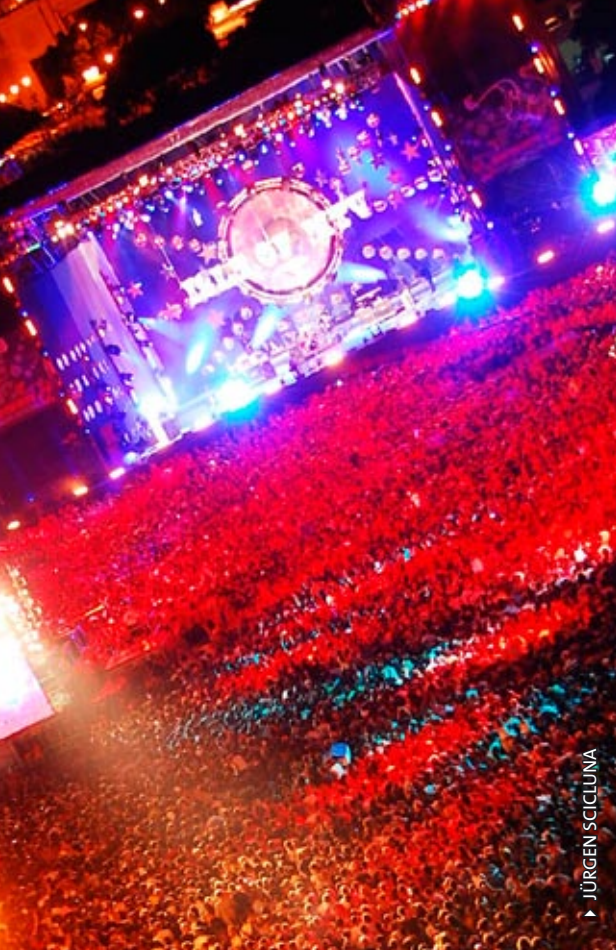
► JURGEN SCICLUNA

Falls Sie sich weniger ernsthaft vergnügen möchten, gibt es unseren Karneval, der im Februar eine Woche lang ausgelassen gefeiert wird und seinesgleichen sucht. Sowohl Kinder als auch Erwachsene lieben den Karneval und freuen sich jedes Jahr auf die Umzüge und Wägen mit ihren verrückten, überlebensgroßen Figuren aus Pappmaché.