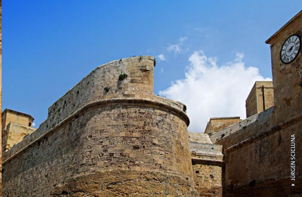
► JURGEN SCICLUNA