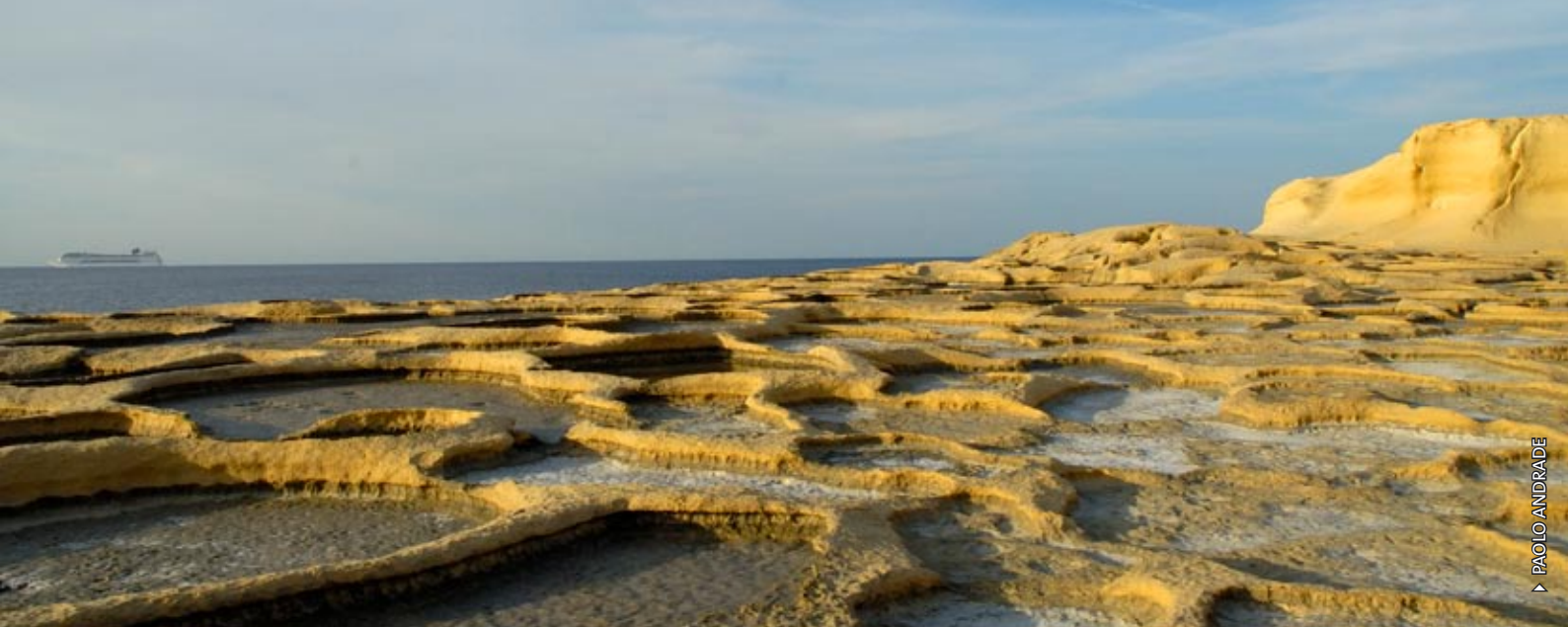
► PAOLO ANDRÀDE