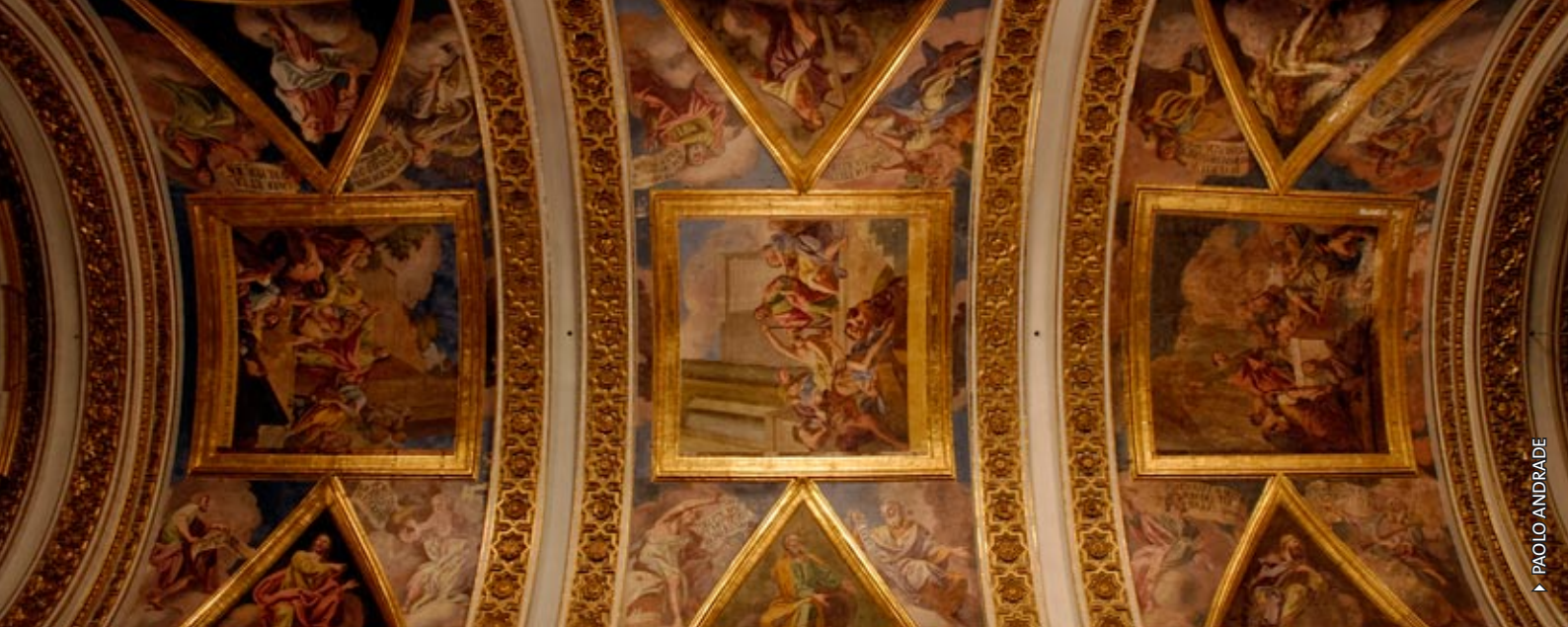
▶ PAOLO ANDRADE