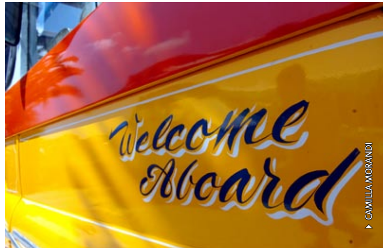
► CAMILLA MORANDI

Malta geht unter die Haut. Vielleicht wird diese kleine Sonneninsel auch zu Ihrem Lieblings-Urlaubsziel und Hideaway?